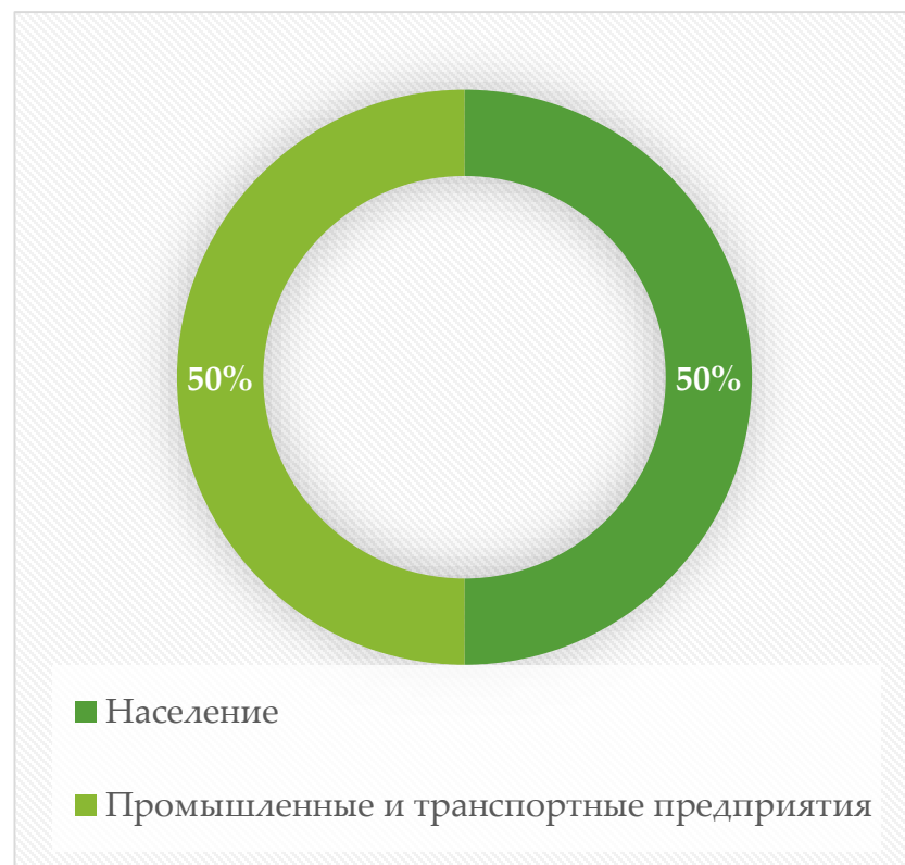
Структура образования изношенных шин